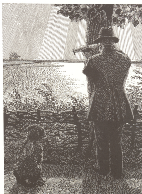
Johannes Larsen: Hygæa krydser ind. 1927. Træsnit. 42 x 38 cm. Johannes Larsen Museet