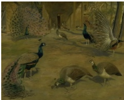
Johannes Larsen: Påfugle. 1903. Olie på lærred. 136,5 x 176,5 cm. Statens Museum for Kunst