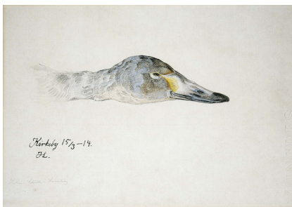
Johannes Larsen: Hoved af Pibesvane. Kirkeby. 1914. Akvarel og tusch. 310 x 480 mm. Johannes Larsen Museet.