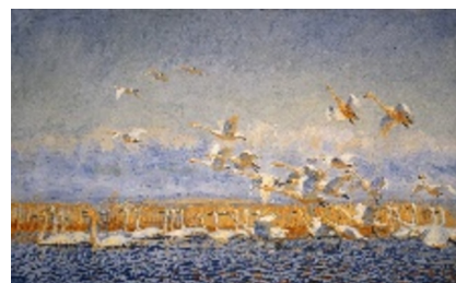
Johannes Larsen: Svanerne letter. Filsø. 1914. Olie på lærred. 221,3 x 134,4 cm. Brandts. Erhvervet 1915