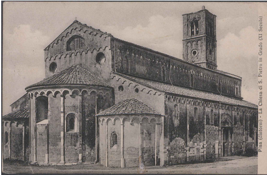
Pisa (dintorni) - La Chiesa di S. Pietro in Grado (XI Secolo)