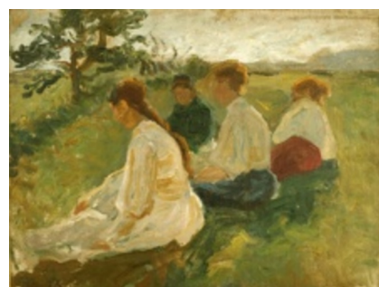
Johannes Larsen: Sommerdag ved brinken. 1896. Olie på pap. 29 x 39 cm. Faaborg Museum