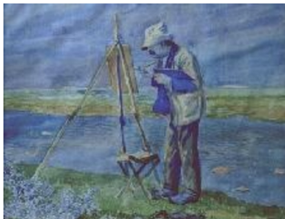
Johannes Larsen: Th. Philipsen maler, Saltholm. 1913. Akvarel. 460 x 600 mm. Faaborg Museum. Købt ca. 1913