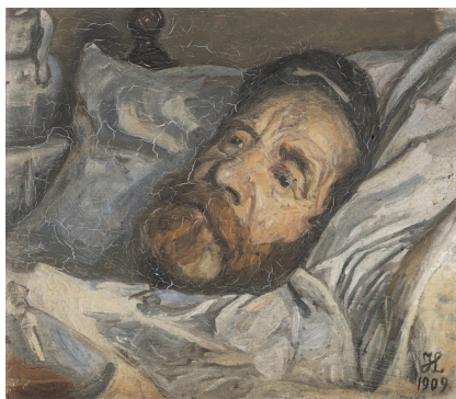
Johannes Larsen: I. A. Larsen i sengen. 1909. Olie på lærred. 36 x 43 cm. Johannes Larsen Museet