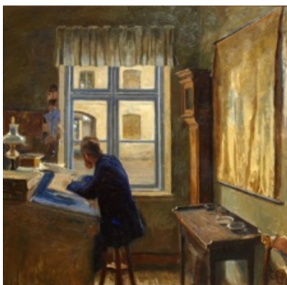
Johannes Larsen: Fra købmandskontoret. Mørk vinterdag. 1895. Olie på lærred. 95 x 95 cm. Faaborg Museum