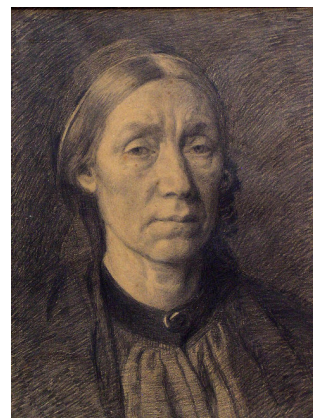
Johannes Larsen: Johannes Larsens moder. 1889. Sortkridt. 410 x 310 mm. Johannes Larsen Museet