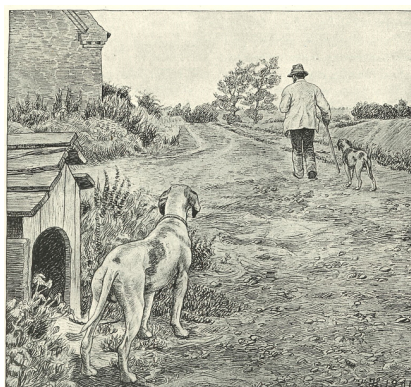
Johannes Larsen: Min Fader og Hundene. 1901. Tusch på papir. Mål og ejer ukendt