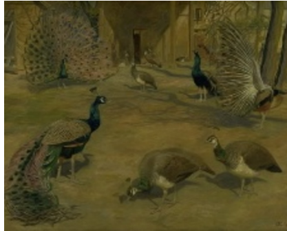
Johannes Larsen: Påfugle. 1903. Olie på lærred. 136,5 x 176,5 cm. Statens Museum for Kunst