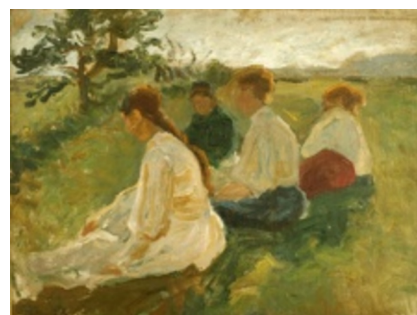
Johannes Larsen: Sommerdag ved brinken. 1896. Olie på pap. 29 x 39 cm. Faaborg Museum