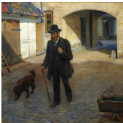
Johannes Larsen: Min fader og Bob. 1892-1893. Olie på lærred. 94 x 94 cm. Faaborg Museum