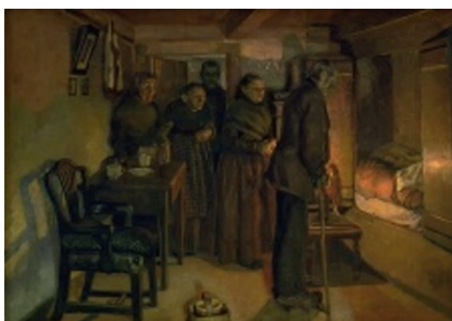
Fritz Syberg: Dødsfaldet. 1890-1892. Olie på lærred. 81,5 x 116,5 cm. Statens Museum for Kunst