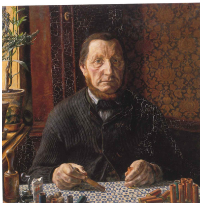
Johannes Larsen: Christian Andersen lader patroner. 1898. Olie på lærred. 73 x 73 cm. Privateje