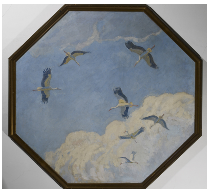
Johannes Larsen: Kredsende storke. 1923-1924. Olie på lærred. 180 x 180 cm. Johannes Larsen Museet