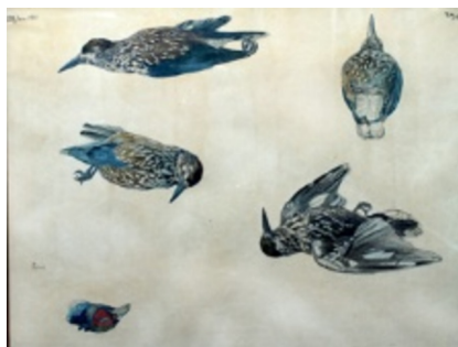
Johannes Larsen: Nøddekrige. 1901. Tusch og akvarel. 500 x 660 mm. Faaborg Museum. Købt 1910