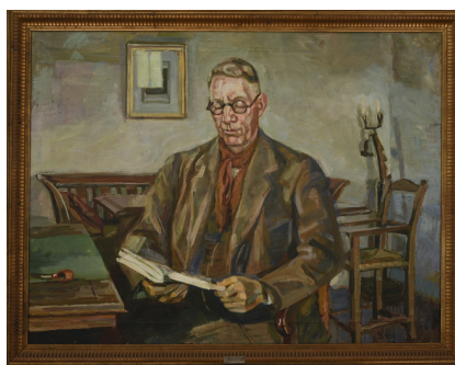
Fritz Syberg: Ved bogen. Portræt af Johannes V. Jensen. 1936. Olie på lærred. 113 x 145. Johannes Larsen Museet