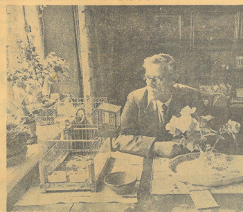
Johannes Larsen ved et af sine Fuglebur.

„Værkstedet“ faar Lys ind fra et smukt vindue i Nordenden. — Jeg har aldrig brugt Ovalsya, jeg bryder mig ikke om den Belysning, siger Johannes Larsen, der videre fortæller, at han har ladet den Vinterhave, der oprindelig hørte til „Værkstedet“, omgaaende til en næstlig Volkrete og Fuglehus, der rummer mange forskellige Slags Fugle, bl. a. Undulater og Kanariefugle samt ogsaa en Del danske Fugle. Han har ikke Tid paa dem, men der er allermindst et halvt Hundrede Stykker.