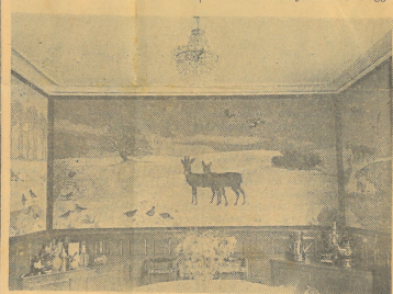
Vægmaleri paa Spisestuens Endevæg.

Mit Øje fanges af et bedarende smukt Maleri paa Loftet. — Det er Forarbejdet til Lotteret Kongens Bibliotek paa Christiansborg, oplyser Kunstneren. — Kan De faa nok Farver i disse Tider? — Det kniber lidt med Aktværelset, hvormed jeg ikke har maaket noget til, at der skulde være Mangt paa Oleifarver. Det er næsten værre at skaffe Papir.