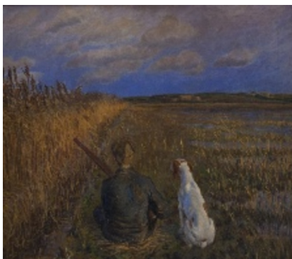
Johannes Larsen: På andetræk. 1896-1897. Olie på lærred. 76 x 87 cm. Statens Museum for Kunst