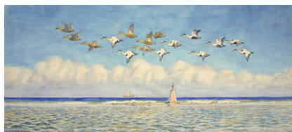
Johannes Larsen: Edderfugle over Hatterrevet. 1949. Akvarel. 33 x 71 cm. Johannes Larsen Museet