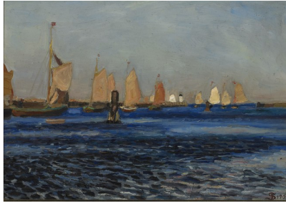
Fritz Syberg Bæltbådene går ud 1907 Olie Johannes Larsen Museet