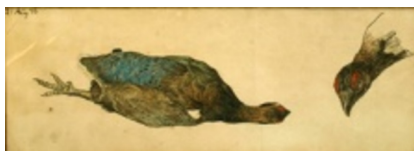
Johannes Larsen: Urhane. 21. aug.1896. Tusch og akvarel. 180 x 480 mm. Faaborg Museum