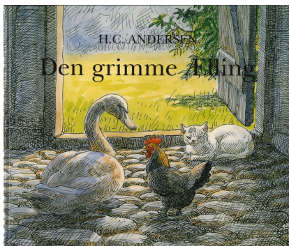
H.C. Andersen: Den Grimme Ælling. Illustreret af Johannes Larsen. Er udkommet i flere oplag