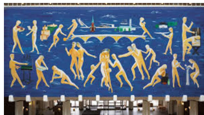
Hagedorn-Olsen: Menneskesamfundet. Vægudsmykning, Århus Rådhus. 145 m 2