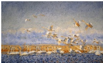
Johannes Larsen: Svanerne letter, Fil Sø. 1914. Olie på lærred. 221,3 x 134,4 cm. Brandts. Erhvervet 1915