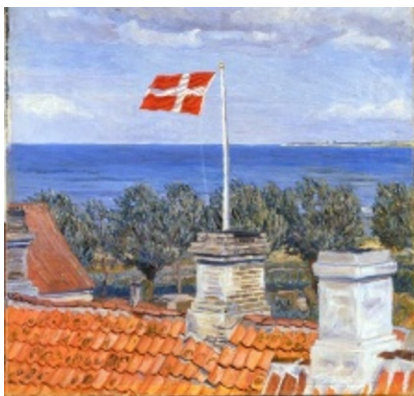
Johannes Larsen: Sommer, solskin og blæst. 1899. Olie på lærred. 44 x 46 cm. Ordrupgaard