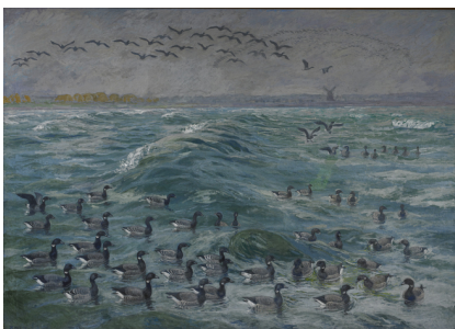
Johannes Larsen: Knortegæs. 1952-1953. Olie på lærred. 200 x 283 cm. Odense Universitetshospital