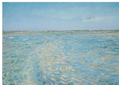
Johannes Larsen: Dønning på Kerteminde Bugt. 1938. Olie på lærred. 200 x 282 cm. Fuglsang Kunstmuseum