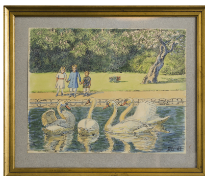
Johannes Larsen: Den Grimme Ælling Den nye er den smukkeste. 1947. Akvarel og tusch. 22 x 28 cm. Johannes Larsen Museet