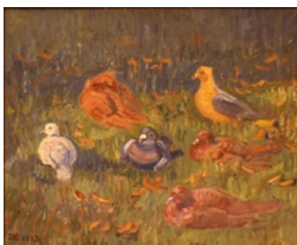
Johannes Larsen: Duer soler sig. 1913. Olie på lærred. 47 x 58 cm. Faaborg Museum. Købt 1914