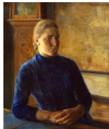
Johannes Larsen: Portræt af min søster. 1890. Olie på lærred. 71 x 61 cm. Faaborg Museum. Købt 1914