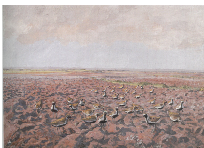
Johannes Larsen: Hjejler i en pløjemark. 1910. Olie på lærred. 66 x 71 cm. Faaborg Museum. Købt 1914