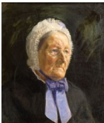
Johannes Larsen: Portræt af min farmoder. 1887. Olie på lærred. 50 x 42 cm. Faaborg Museum. Købt 1914