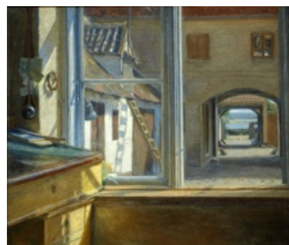
Johannes Larsen: Min faders købmandskontor. 1889. Olie på lærred. 61 x 72 cm. Faaborg Museum. Købt 1914