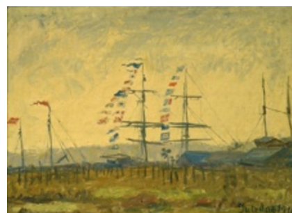
Johannes Larsen: Juledag. 1910. Olie på lærred. 60 x 80 cm. Faaborg Museum. Købt 1914