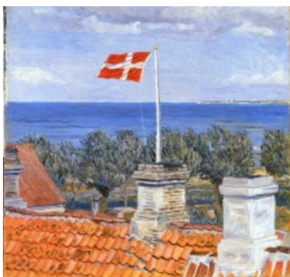
Johannes Larsen: Sommer, solskin og blæst. 1899. Olie på lærred. 44 x 46 cm. Ordrupgaard