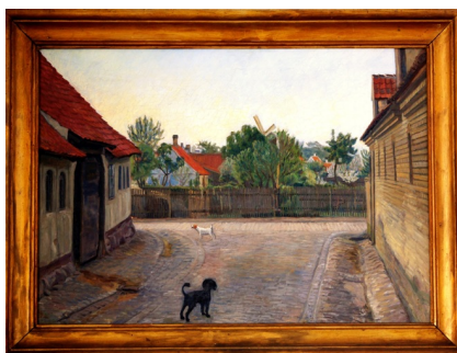
Johannes Larsen: Gade i Kerteminde med to hunde. 1899. Olie på lærred. 76 x 54 cm. Kerteminde Kommune.