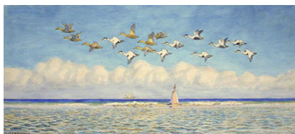
Johannes Larsen: Edderfugle over Hatterrevet. 1949. Akvarel. 33 x 71 cm. Johannes Larsen Museet