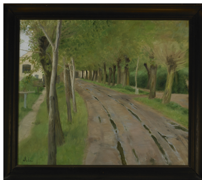
Johannes Larsen: Landevej efter regn. 1887.olie på lærred. 48 x 55,5 cm. Johannes Larsen Museet