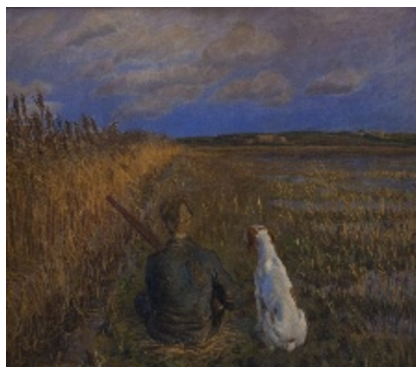
Johannes Larsen: På andetræk. 1895-1897. Olie på lærred. 76,5 x 87 cm. Statens Museum for Kunst