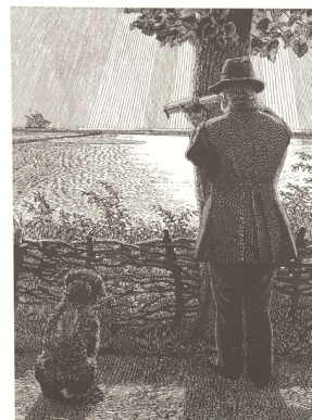
Johannes Larsen Hygæa krydser ind 1927 træsnit 42x38 Johannes Larsen Museet