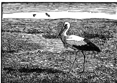
Johannes Larsen Storken Træsnit 1914 ca.10x7 Johannes Larsen Museet