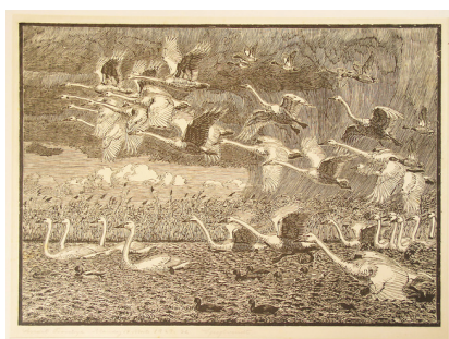
Johannes Larsen Svaner letter ved Fiil sø 1927 træsnit 38x52 Johannes Larsen Museet