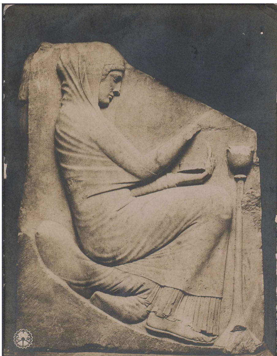
230 ROMA. Museo delle Terme. La Sposa.