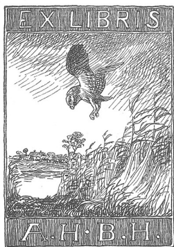
Johannes Larsen: Ex libris til AHBH. U.å. Træsnit. Indlagt i brevet