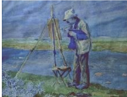
Johannes Larsen: Philipsen maler. Saltholm. 1913. Akvarel. 460 x 600 mm. Faaborg Museum. Købt ca. 1913