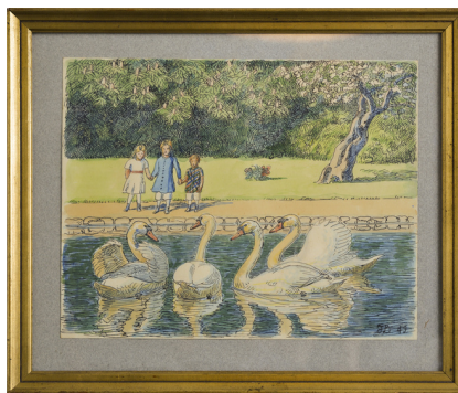
Johannes Larsen: Den Grimme Ælling. Den nye er den smukkeste. 1947. Akvarel og tusch. 22 x 28 cm. Johannes Larsen Museet