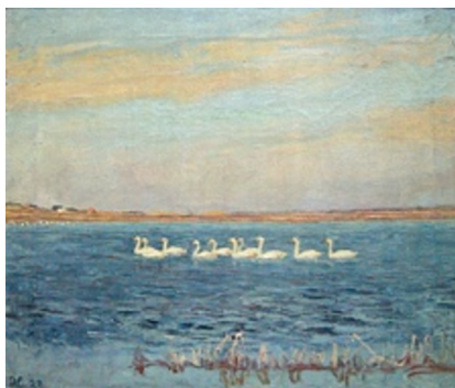
Johannes Larsen: Svaner i Filsø. 1922. Olie på lærred. 57,5 x 68 cm. Johannes Larsen Museet. Købt 2003