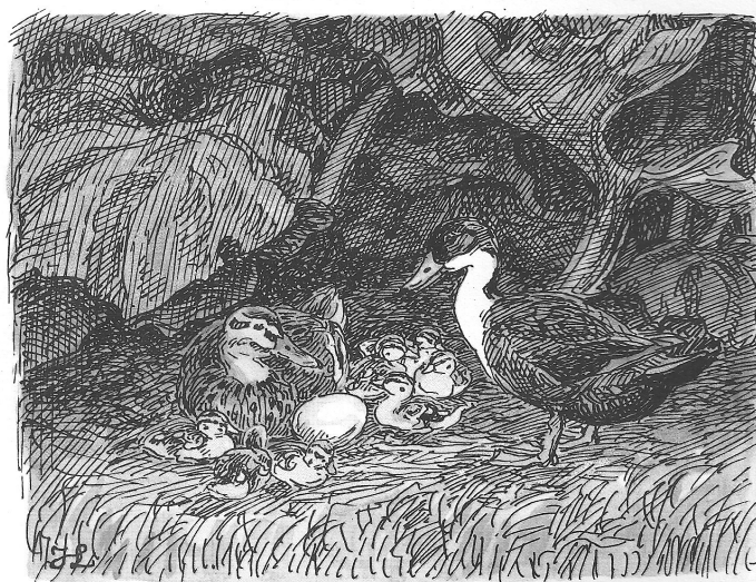
»Du kan tro, det er et Kalkunæg -«