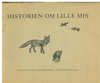
Johannes Larsen Historien om lille Mis Træsniudsudgaven