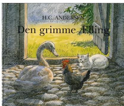
HC Andersen: Den grimme ælling. Illustrationer af Johannes Larsen