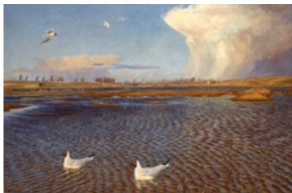
Johannes Larsen: Bygevej i april. 1901-1907. Olie på lærred. 131 x 197 cm. Faaborg museum. Købt 1910