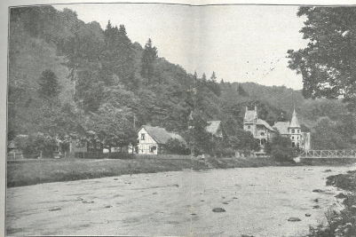
Partie an der Bode

Ab Blankenburg: abfahren alle Tage an Treseburg: ab Wernigerode: an Treseburg: ab Suderode: an Treseburg: