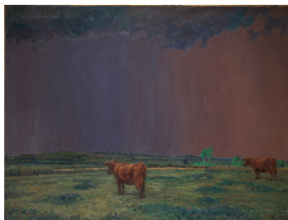
Johannes Larsen: Køer i tordenvejr. 1908. Olie på lærre. 91 x 121 cm. Privateje