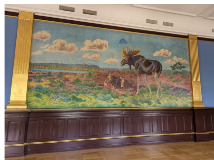
Johannes Larsen: Elsdyr. 1935-1936. Fresko. Odense Rådhus