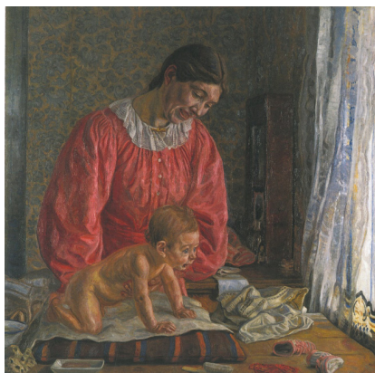
Johannes Larsen: Moder og barn. Båxhult, 1899.olie på lærred. 92 x 92 cm. Johannes Larsen Museet