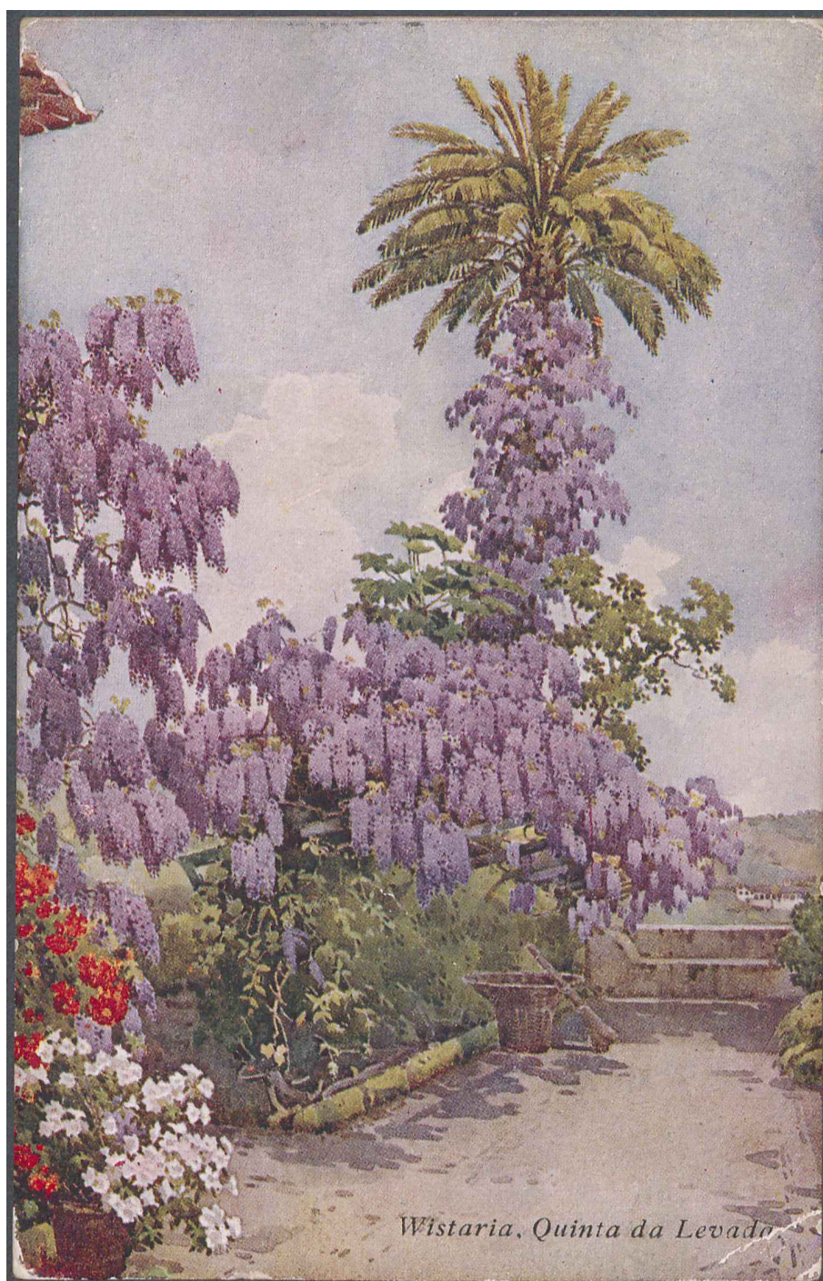
Wistaria, Quinta da Levada