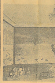
Vægmaleri paa Spisestuens Endevæg.

— Det er Forarbejdet til Lottet Kongens Bibliotek paa Christiansborg, oplyser Kunstneren. — Kan De faa nok Farver i disse Tider? — Det kniber lidt med Akvarelfarver, hvorefter jeg ikke har maaket noget til, at der skulde være Mangt paa Oleifarver. Det er næsten værre at skaffe Papir.