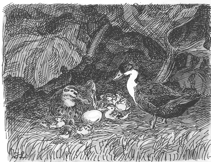
»Du kan tro, det er et Kalkunæg -«