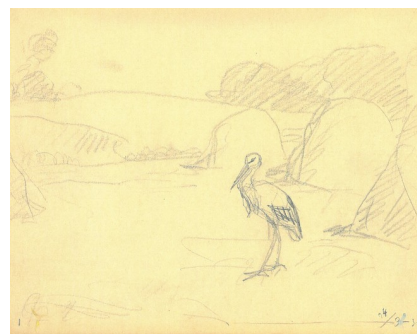
Fritz Syberg: Stork med landskab. Udkast til den grimme Ælling. 1930 Blyant på papir. 200 x 250 mm. Johannes Larsen Museet