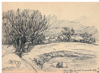
Fritz Syberg: Skitse til Den grimme Ælling. 1928-1929. Tusch på papir. 250x340 mm. Kobberstiksamlingen