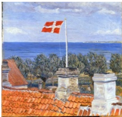
Johannes Larsen: Sommer, solskin og blæst. 1899. Olie på lærred. 44 x 46 cm. Ordrupgaard