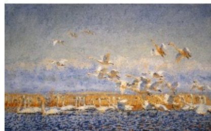
Johannes Larsen: Svanerne letter, Filso. 1914. Olie på lærred. 221,3 x 134,5 cm. Brandts