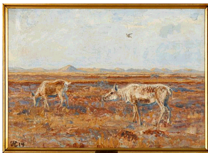
Johannes Larsen: To rensdyr ved Fiilsø. 1914. Olie på lærred. Nymindegab Museum