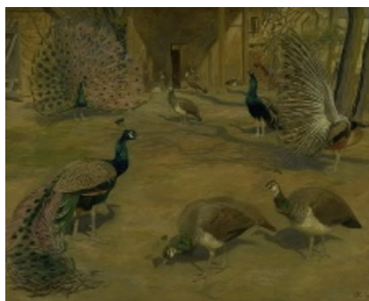
Johannes Larsen: Påfugle. 1903. olie på lærred. 136,5 x 176,5 cm. Statens Museum for Kunst

Johannes Larsen har stået indendørs og malet et billede af kroen samt to billeder med svaner. Det er uklart, hvad billedet "Fjorden" er for et. ▼ entryk af Trækfuglene: Johannes Larsen illustrerede en ny udgave af St. St. Blichers Trækfuglene med træsnit.