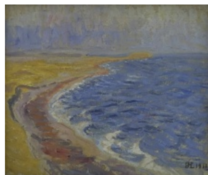
Johannes Larsen: Decembersolskin ved Snavestrand. 1911. Olie på lærred. 47,5 x 58 cm. Statens Museum for Kunst. Inv. KMS4095. Købt 1935