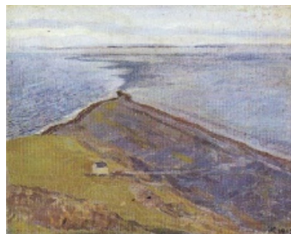
Johannes Larsen: Vesterrevshuset. Solskin. Sprogø. 1913. Olie på lærred. 59 x 74 cm. Johannes Larsen Museet. Inv. nr. 2-936. Købt 1998